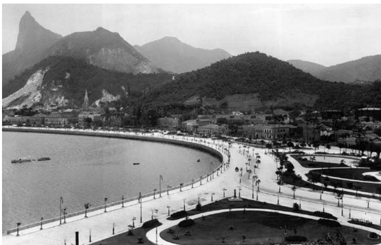
Avenida Beira-Mar (década de 1910)