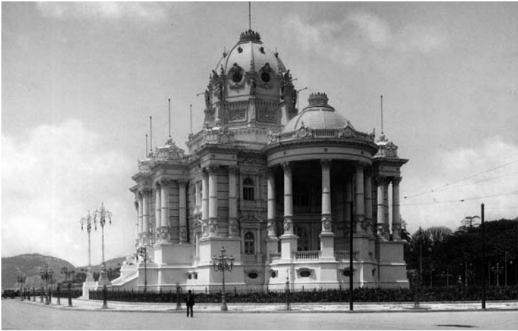
Palácio Monroe (década de 1910)

Passos para construir a avenida Central fez desaparecer os imóveis que abrigavam os clubes de remo, entre eles o Vasco da Gama. Naquele local, a Prefeitura instalou o Palácio Monroe, local onde até 1922 funcionou a Câmara dos Deputados e, de 1925 a 1930, a sede do Senado Federal. O prédio foi demolido em 1976, por conta das obras do metrô, e o local, transformado em uma grande praça, onde se localiza uma estação de embarque e desembarque de passageiros com o mesmo nome: Cinelândia.