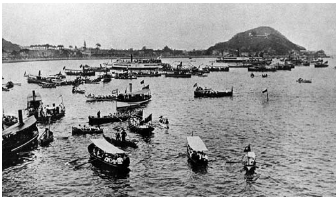
Campeonato de regatas na enseada de Botafogo, em 1905

rar as atividades esportivas náuticas, ficava instalada na Travessa Maia, próximo à Baía de Guanabara, na orla do Passeio Público e de Santa Luzia. Ali, com a ajuda dos primeiros sócios, o Vasco inaugurou a garagem para abrigar seus primeiros barcos.