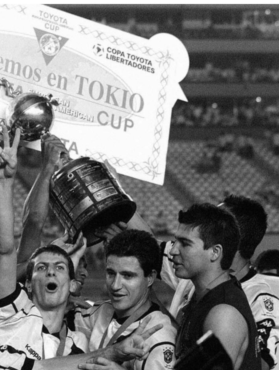
em que o Vasco venceu o Barcelona de Guayaquil, do Equador, por 2 x 1